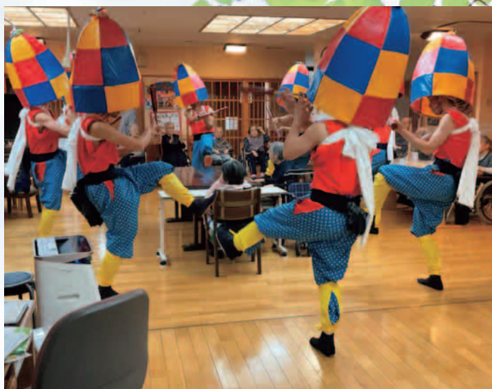
▲恵翔苑 蛭川安弘見神社 杵振り踊り 保存会の方が、踊りを披露してくださいました。