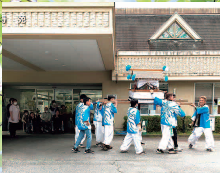
▲福寿苑 上矢作 熊野神社 御例祭の御神輿を披露してくださいました。