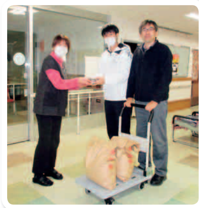
上矢作小学校の皆さんが作ったお米を頂きました。