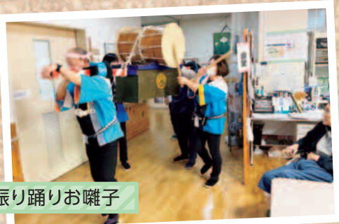
杵振り踊りお囃子