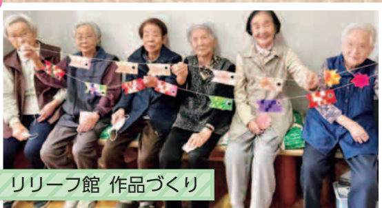
リリーフ館 作品づくり